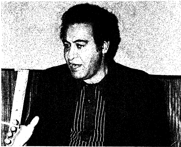
محاضرة في مدرسة الكادر للجبهة الشعبية لتحرير فلسطين عام ١٩٨٩